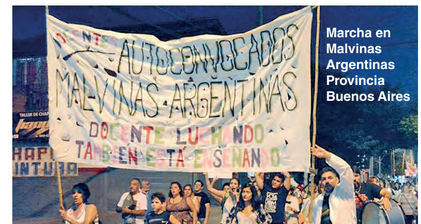
Marcha en Malvinas Argentina Provincia Buenos Aires