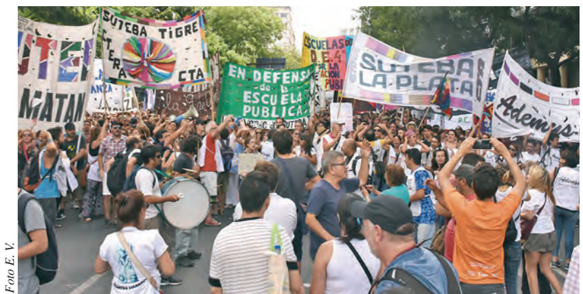
Los Sutebas multicolor en una de las marchas