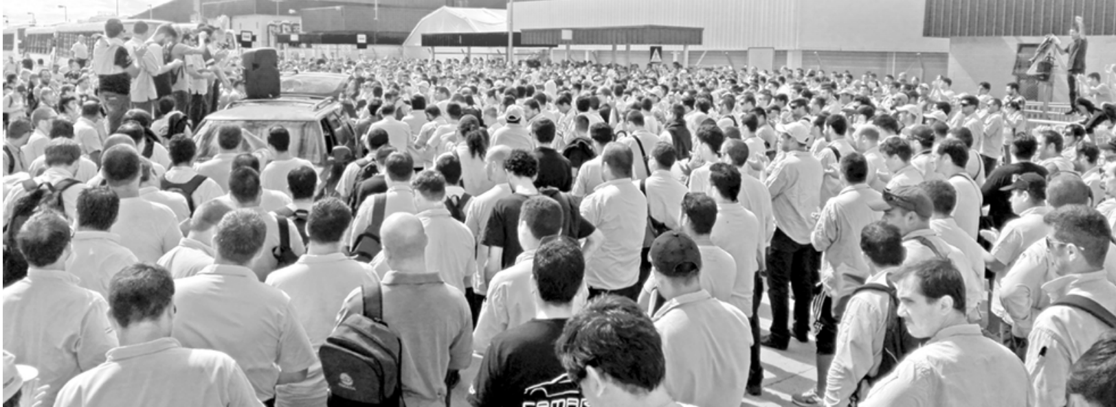
Multitudinaria asamblea en la planta de Alvear, Santa Fe

El 1 de Marzo -día del trabajador mecánico- la conducción del Smata, con 20 delegados de General Motors (de 22 en total) firmó un acta a espaldas de los trabajadores aceptando 350 despidos, tras un período de 9 meses de suspensión a partir del 6 de marzo. Hubo una asamblea de más de 1.000 compañeros el jueves. Se formó un comité de lucha para derrotar el acta antiobrera.