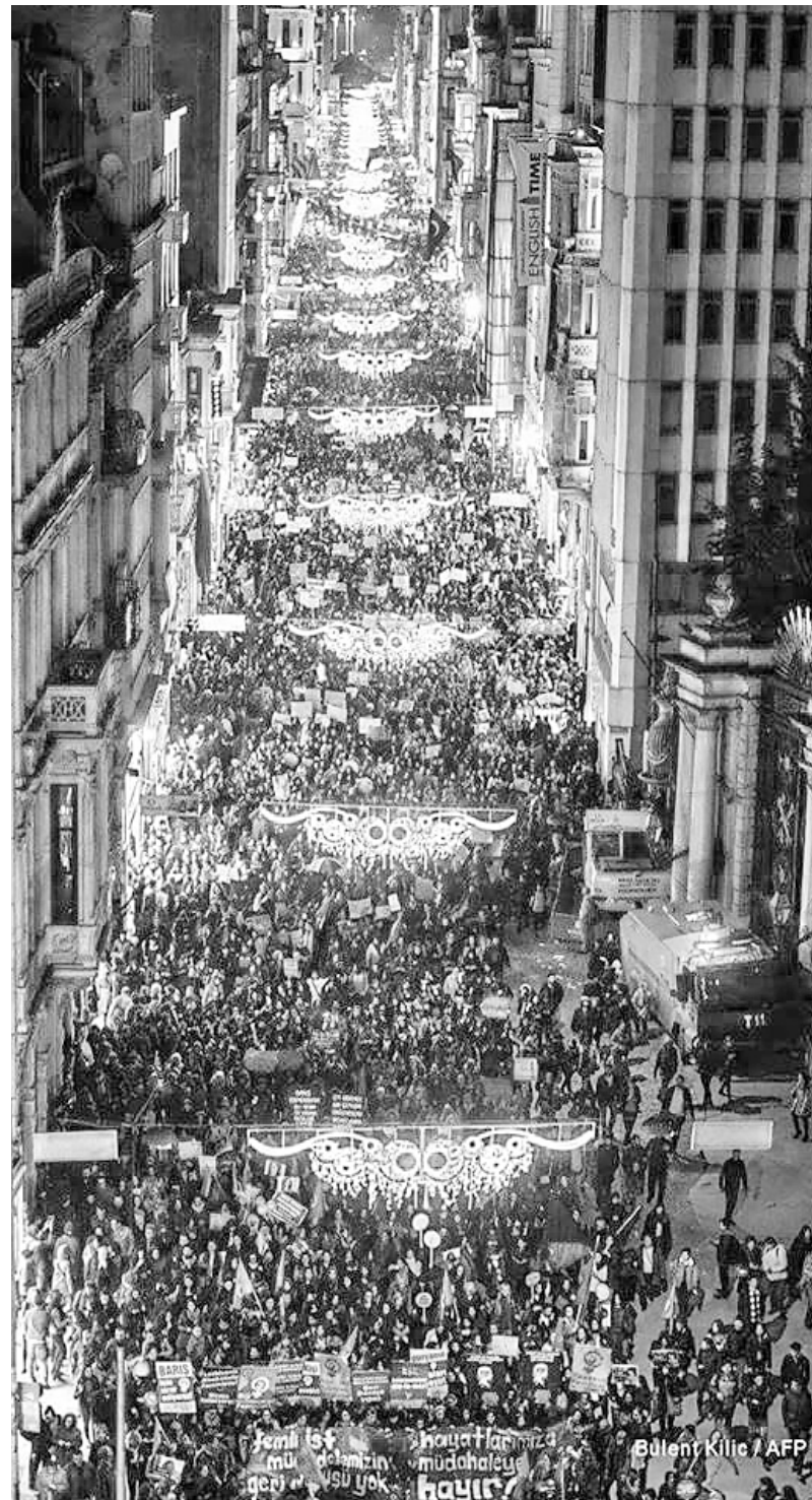
Importante movilización en Estambul, Turquía

Con todos estos datos, podemos decir que estamos atravesando un momento clave en la lucha de las mujeres, por su carácter internacional y por su contenido político. Las enormes movilizaciones en todo el mundo reflejan el hartazgo de las mujeres más postergadas de la sociedad no solo con el sistema patriarcal sino con el sistema capitalista que nos superexplota, nos discrimina en el trabajo, vende nuestros cuerpos en las redes de trata y nos condena a las más