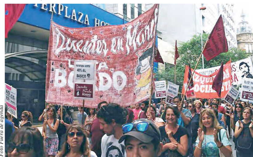
Marcha en Córdoba

delegaciones de sindicatos opositores del país que integran la Coordinación Nacional de docentes combativos. ¡Sólo de Matanza vinieron 25 micros y muchos docentes tuvieron que ir por su cuenta! Casi 400 docentes autoconvocados de Malvinas viajaron en trenes. Y en todos los puntos de la provincia miles de maestras tuvieron que quedarse por falta de lugares en los micros.