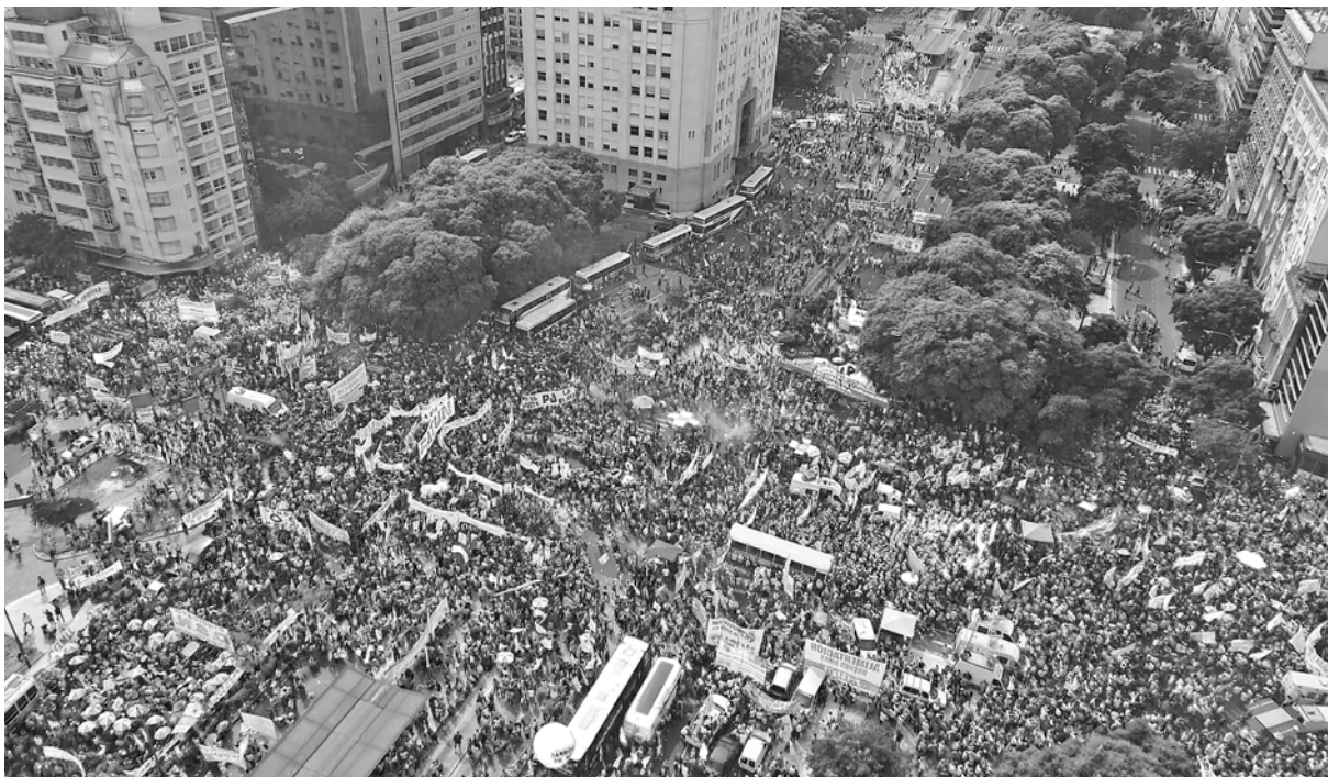
Vista de la masiva movilización de la CGT

La rechifla a cada uno de los triunviros fue masiva. La “unidad” que la burocracia cegetista había querido mostrar en el palco (donde