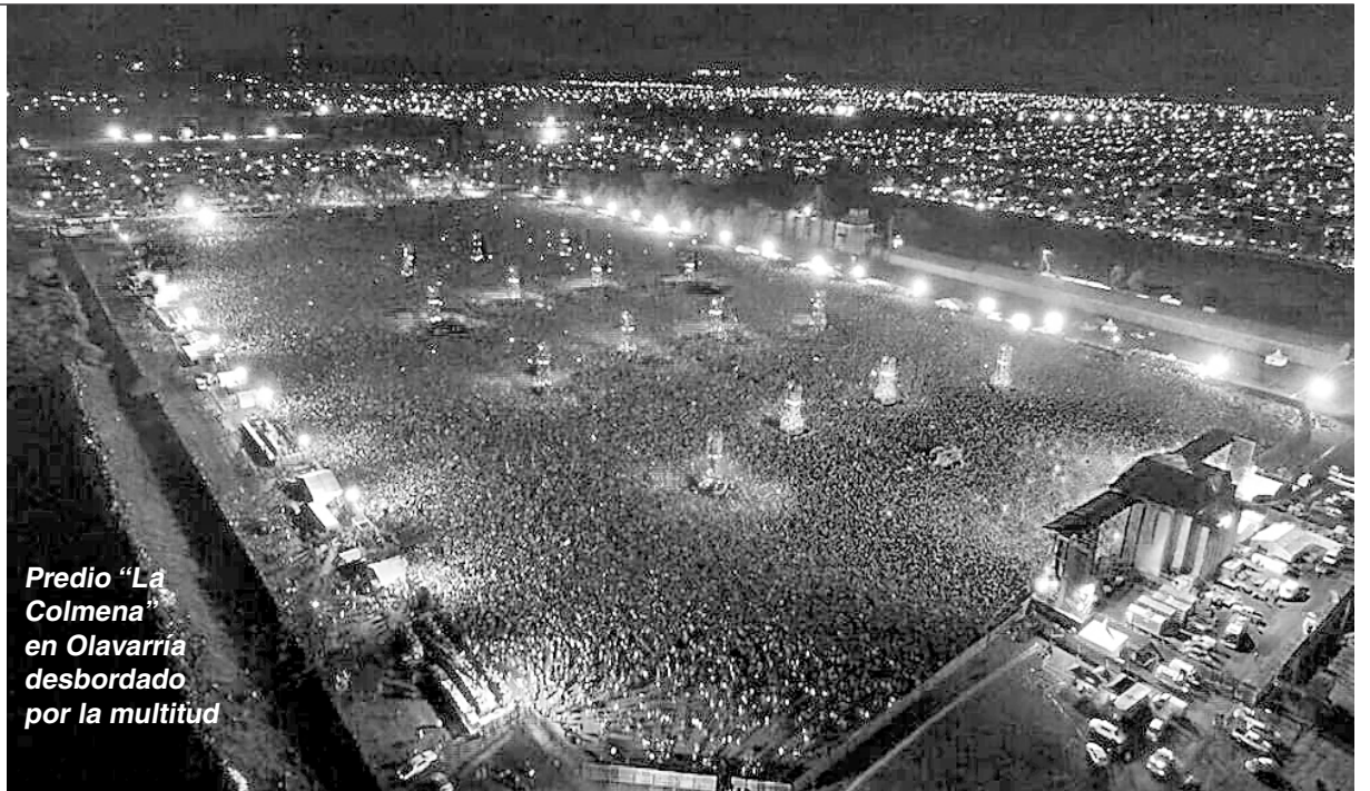
Predio “La Colmena” en Olavarría desbordado por la multitud

“Son pájaros de la noche que oímos cantar y nunca vemos. Cuando el granizo golpeó la campana sonó. despertó sus tristezas atronando sus nidos” Fragmento de la letra “Juguetes perdidos”, Redonditos de Ricota 1996 .