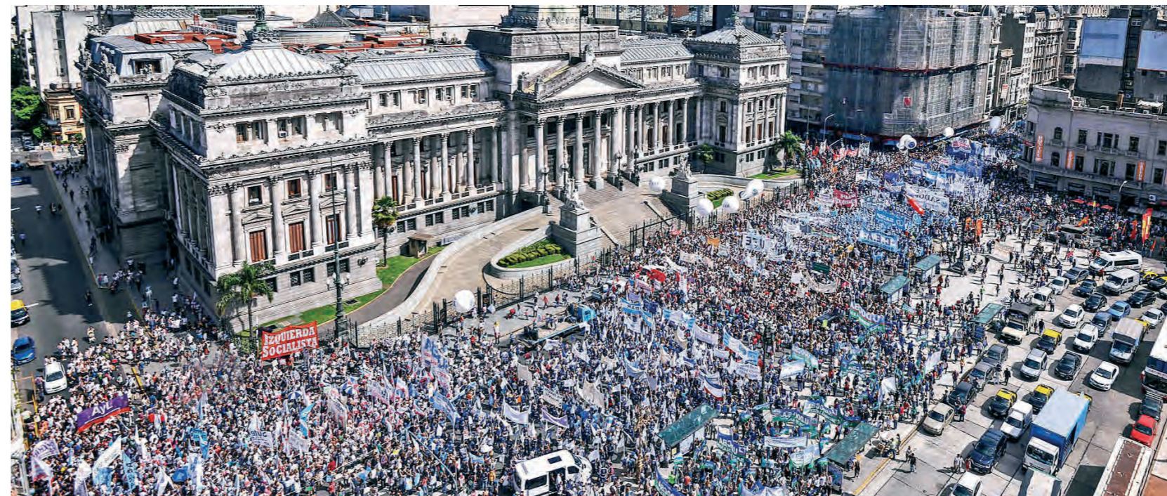
Multitudinaria marcha en Capital