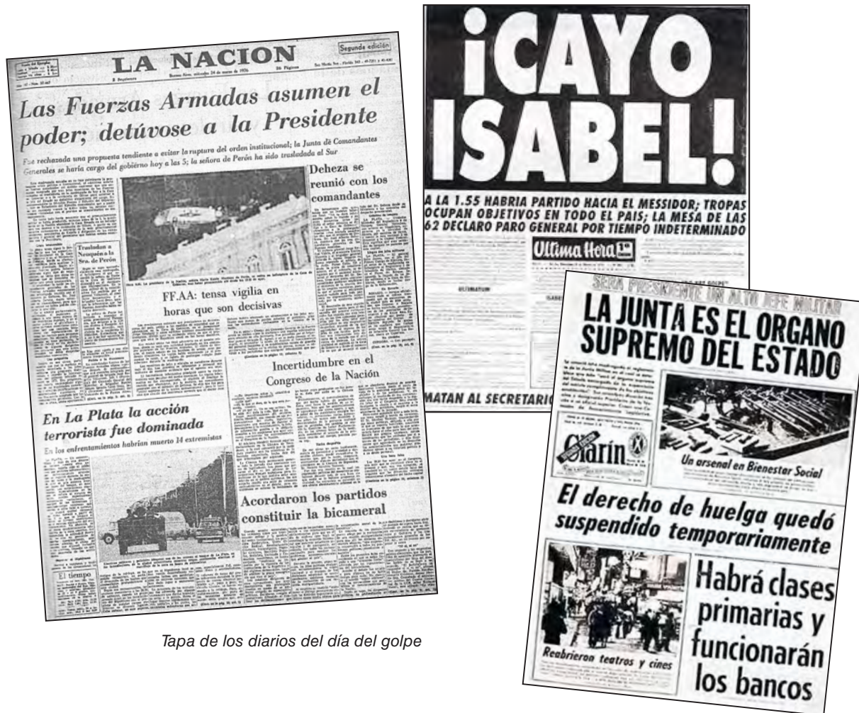
Tapa de los diarios del día del golpe

Hace 41 años comenzaba la última de las dictaduras de nuestro país. Fue la más antiobrera y genocida, con 30 mil detenidos-desaparecidos. En 1982 fue echada por la movilización popular. Desde ese año comenzó el reclamo por memoria, verdad y justicia. La lucha continúa bajo el gobierno de Macri, que busca profundizar la impunidad ensuciando el histórico reclamo popular.