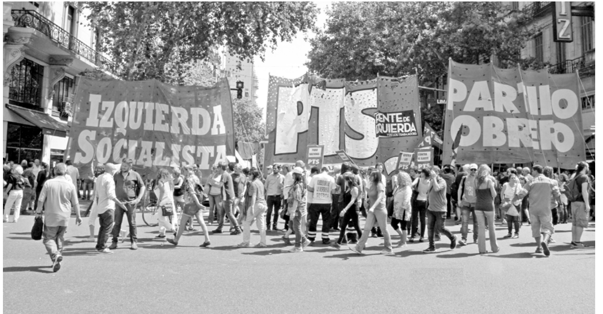
Los partidos que integran el FIT en una de las movilizaciones recientes

Con otras palabras el PTS está diciendo que: 1) ellos son los “mejores” para encabezar las listas de Capital y Provincia, menospreciando a los dirigentes del PO e Izquierda Socialista que tienen una importante trayectoria política y de lucha; 2) son individualmente sus figuras las que tienen peso, desconociendo el hecho de que la fuerza de todos los candidatos del FIT proviene de la unidad de la izquierda. Ni Del Caño ni Pitrola ni