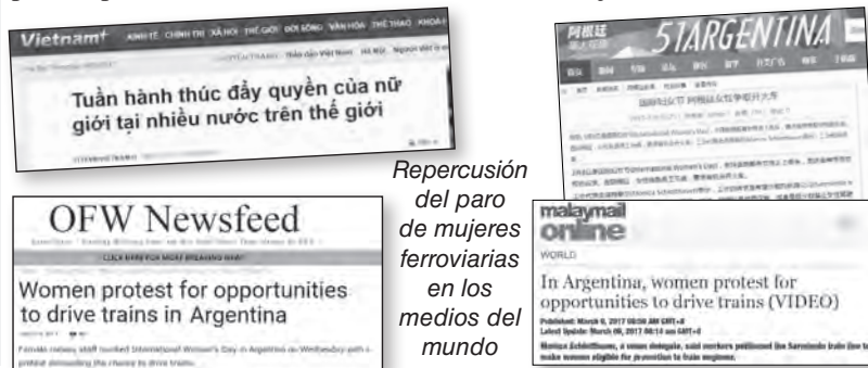
Repercusión del paro de mujeres ferroviarias en los medios del mundo

que abandonar la provincia tras sufrir amenazas de muerte y persecución en sus lugares de trabajo. En otras provincias, las amenazas, ataques y difamaciones contra las mujeres que participaron del 8M se multiplican. Pero no es una casualidad, son todos hechos que forman parte de una campaña nacional del gobierno de Macri, los gobiernos locales y las iglesias para frenar al movimiento de mujeres que cada vez viene manifestándose con más fuerza. Por eso debemos repudiar con fuerza este tipo de hechos y denunciar al gobierno nacional, a los gobiernos provinciales y a las iglesias por la violencia que siguen ejerciendo sobre las mujeres.